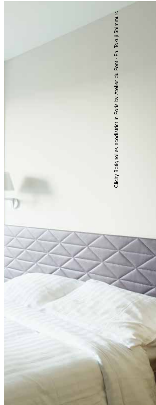
Clichy-Batignolles ecodistrict in Paris by Atelier du Pont