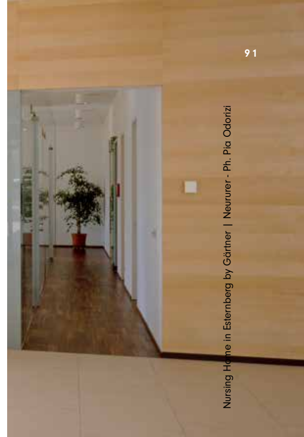
Nursing Home in Esternberg by Görtner | Neururer