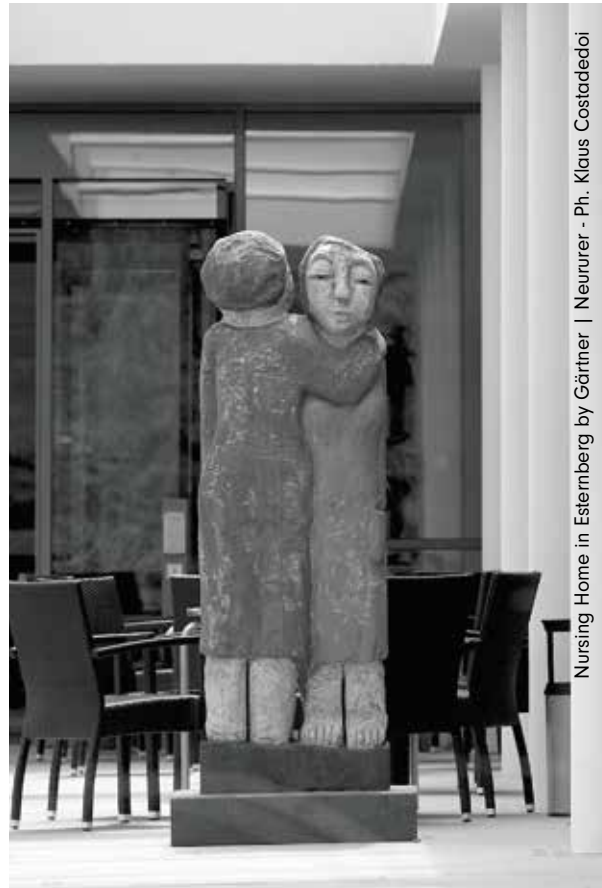
Nursing Home in Esternberg by Görtner | Neururer

Negli Stati Uniti, in Gran Bretagna, Danimarca, Germania, Francia, ma anche in Spagna e Portogallo, dove arrivano molti clienti dal nord Europa, le senior houses sono un business in continua crescita. Si tratta di stabili con appartamenti per lo più dati in affitto e progettati appositamente per anziani con capacità di spesa medio-alta, che mettono a disposizione spazi per attività comuni e una serie di servizi compresi nel canone mensile.