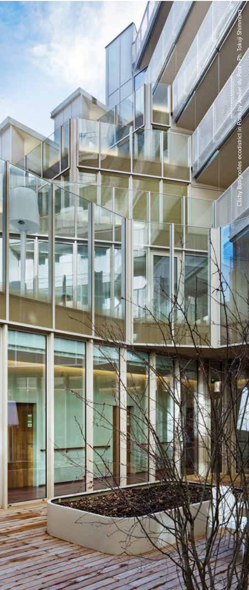
Clichy Batignolles ecodistrict in Paris by Atelier du Pont