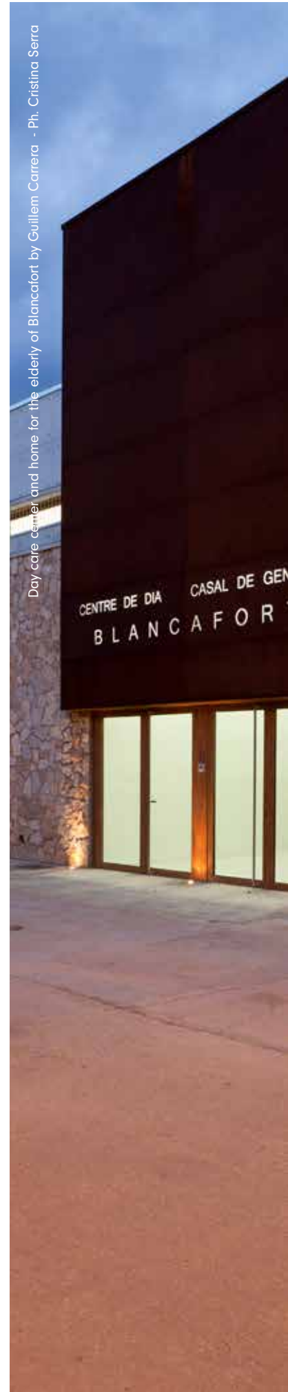
Day care center and home for the elderly of Blancafort by Guillem Carrera

IN THE UNITED STATES, GREAT BRITAIN, DENMARK, GERMANY, FRANCE, BUT ALSO IN SPAIN AND PORTUGAL, WHERE MANY CUSTOMERS COME FROM NORTHERN EUROPE, 'SENIOR HOUSES' ARE A GROWING BUSINESS. THESE ARE RESIDENTIAL BUILDINGS CONTAINING MOSTLY RENTED APARTMENTS AND DESIGNED SPECIFICALLY FOR SENIOR CITIZENS WITH MEDIUM-HIGH PURCHASING POWER AND WHICH PROVIDE SPACES FOR COMMUNAL ACTIVITIES AND A RANGE OF AMENITIES INCLUDED IN THE MONTHLY FEE.