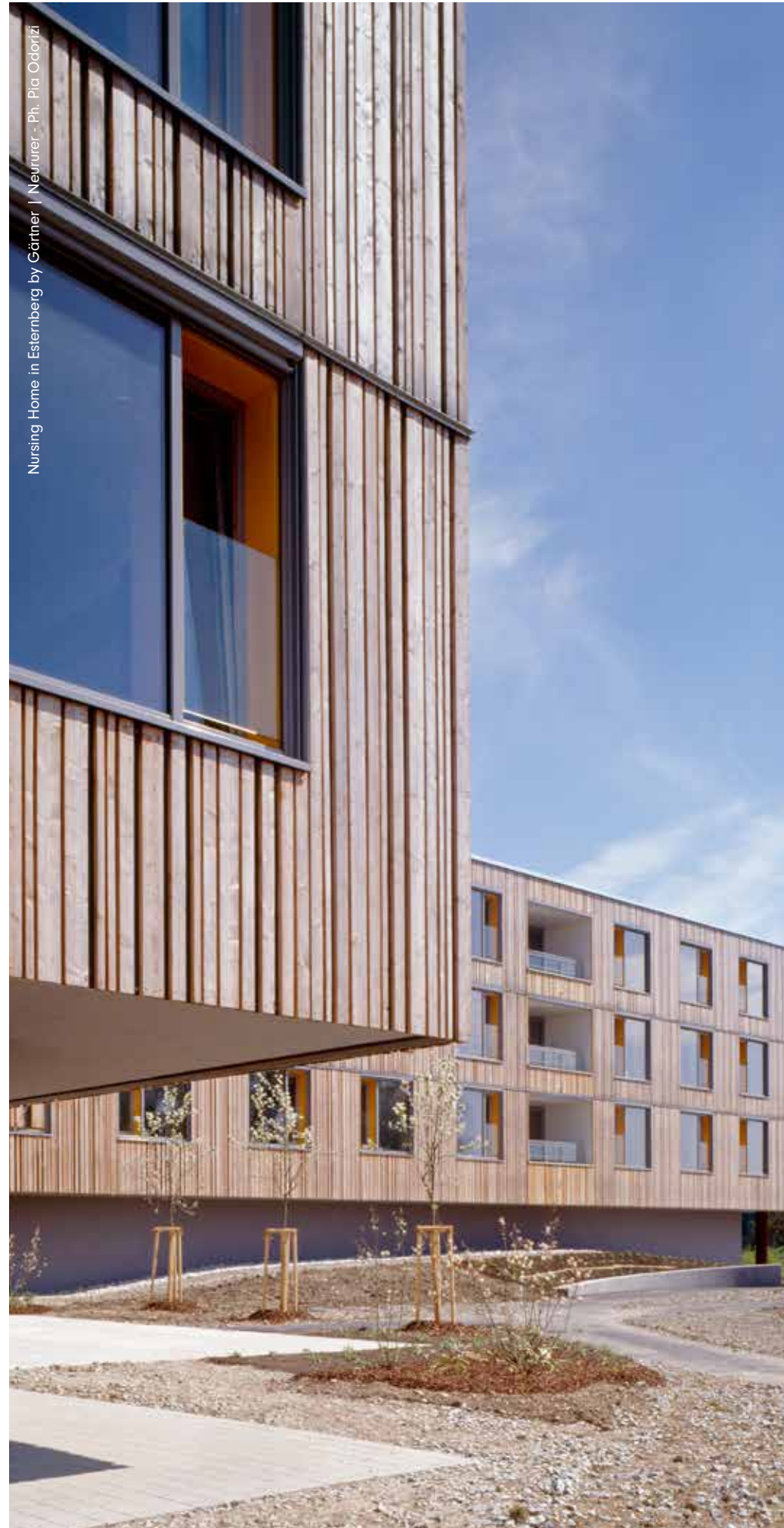
Nursing Home in Esterberg by Gärtner | Neururer